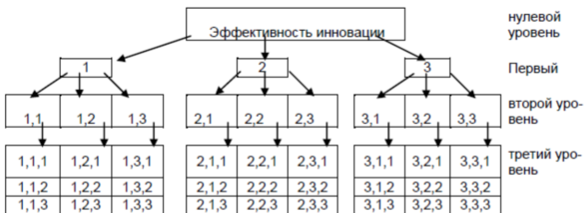
Рис.1 Структура дерева целей

Так, например, при разработке новой технологии компанией были определены следующие стратегические цели ее использования: «создать новую производственную систему для наращивания потенциала организации; упрочить позиции фирмы на рынке конкурентоспособной продукции» на основе конкурентных преимуществ, полученных фирмой при разработке новой технологии, создать предпосылки для дальнейшей экспансии на рынке.