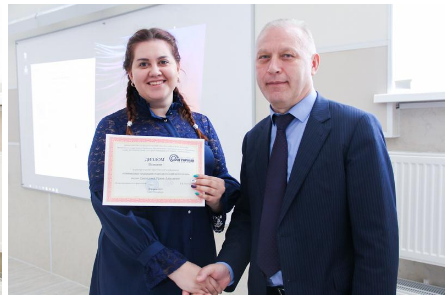
Научно-практическая конференция «Современные тенденции развития российского права»