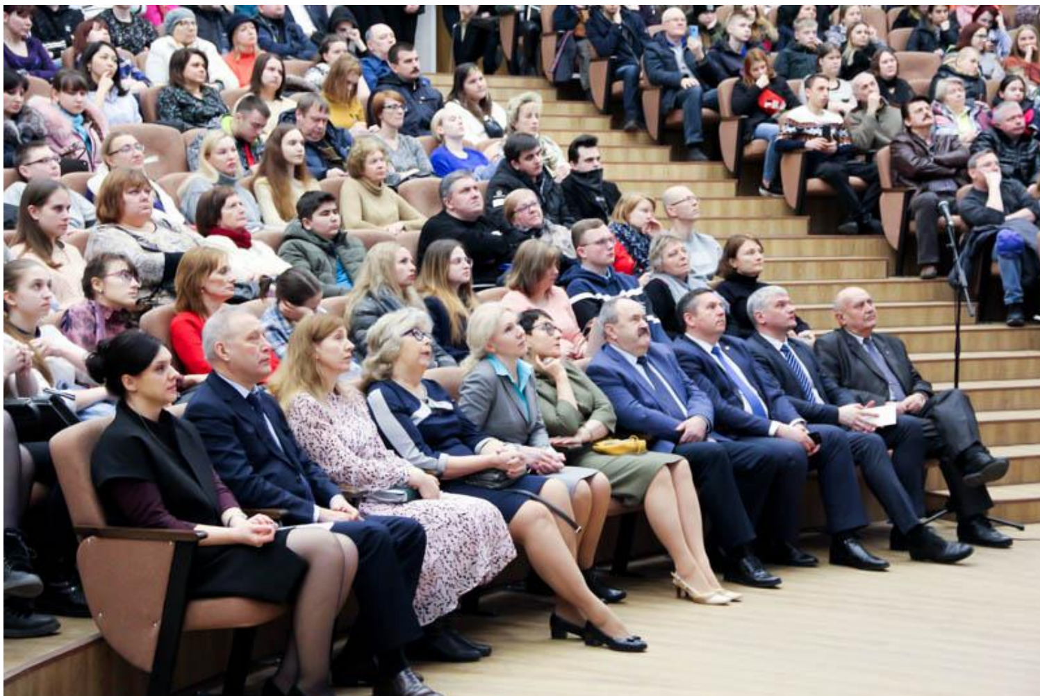
День открытых дверей 14 марта 2020 г.